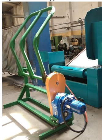
Опрокидыватель рулонов льна ОРЛ-1